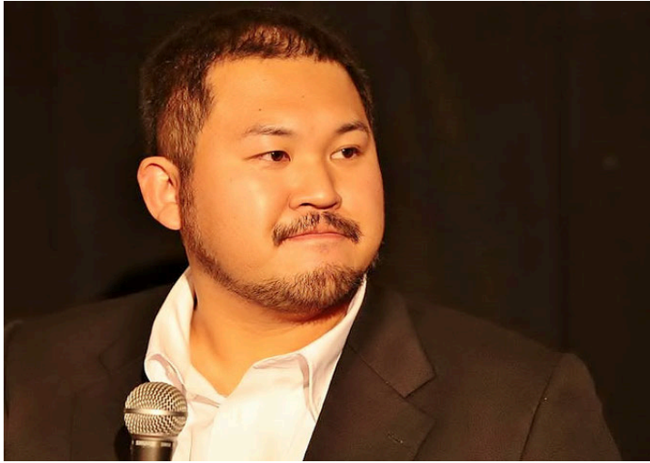
渡边纮文(电影导演)